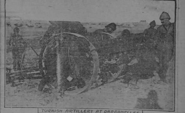
TURKISH ARTILLERY AT DARDANELLES

Debido a la inferioridad de la artillería turca la lucha reciente en los Dardanelos ha dado por resultado que los aliados puedan avanzar considerablemente. Las tropas francesas bajo los órdenes del General Gouraud se han destacado especialmente. Un corresponsal desde Atenas dice que el frente turco no excede de tres mil y cuatro, y frente especialmente por la artillería de los aliados. Los turcos están preparando con grandes dificultades para que lleguen a las baterías y al mismo tiempo que los aliados tienen todas las facilidades para hacerlo.