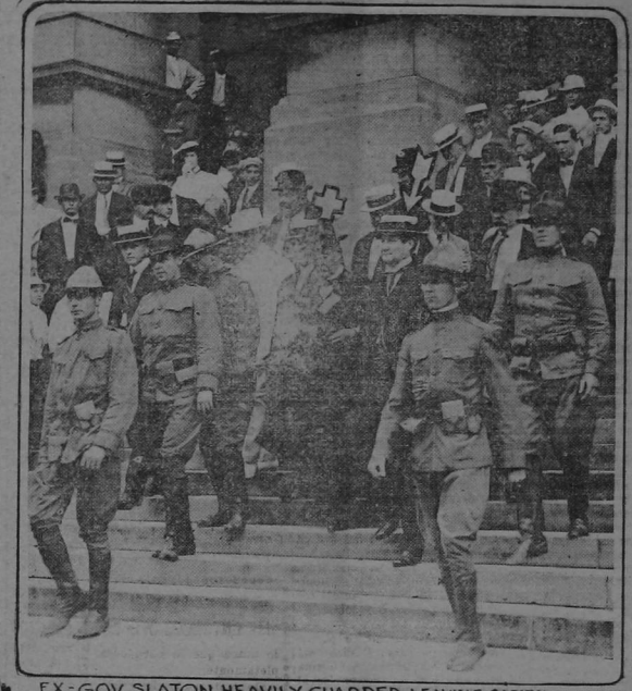
EX-GOV. SLATON, HEAVILY GUARDED, LEAVING CAPITOL AT ATLANTA

Este grabado muestra al Gobernador del Estado de Georgia, Slaton, (indicado por una flecha) y el nuevo Gobernador, Nat. E. Harris, (indicado por una cruz) al salir del Capitolio en Atlanta después del juramento de ley. Es de notar los soldados que rodean al ex-Gobernador. Esta precaución se tomó en vista de la indignación pública que aún existe contra ese funcionario a consecuencia de labor conmutada la sentencia de muerte dictada contra Leo, Frank, a quien se acusó de haber asesinado a una niña de catorce años llamada Mary Phagan y quien trabajaba en la misma fábrica de lápices en que Frank era administrador. El Gobernador conmutó la sentencia en vista de que las pruebas aducidas contra el sentenciado dejaban lugar a duda respecto a su culpabilidad en el delito que se le imputaba.